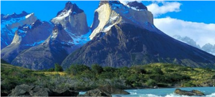
Torres del Paine