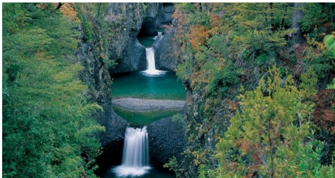
Siete Tazas

Din punct de vedere geografic, zona este caracterizată de prezența văilor întinse cu pante domoale, care permit dezvoltarea activităților agricole. Cordiliera Anzilor atinge în această regiune înălțimea medie de 3.500 de metri, vulcanii fiind de asemenea prezenți.